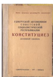
(Обложка Конституции 1937 г.)