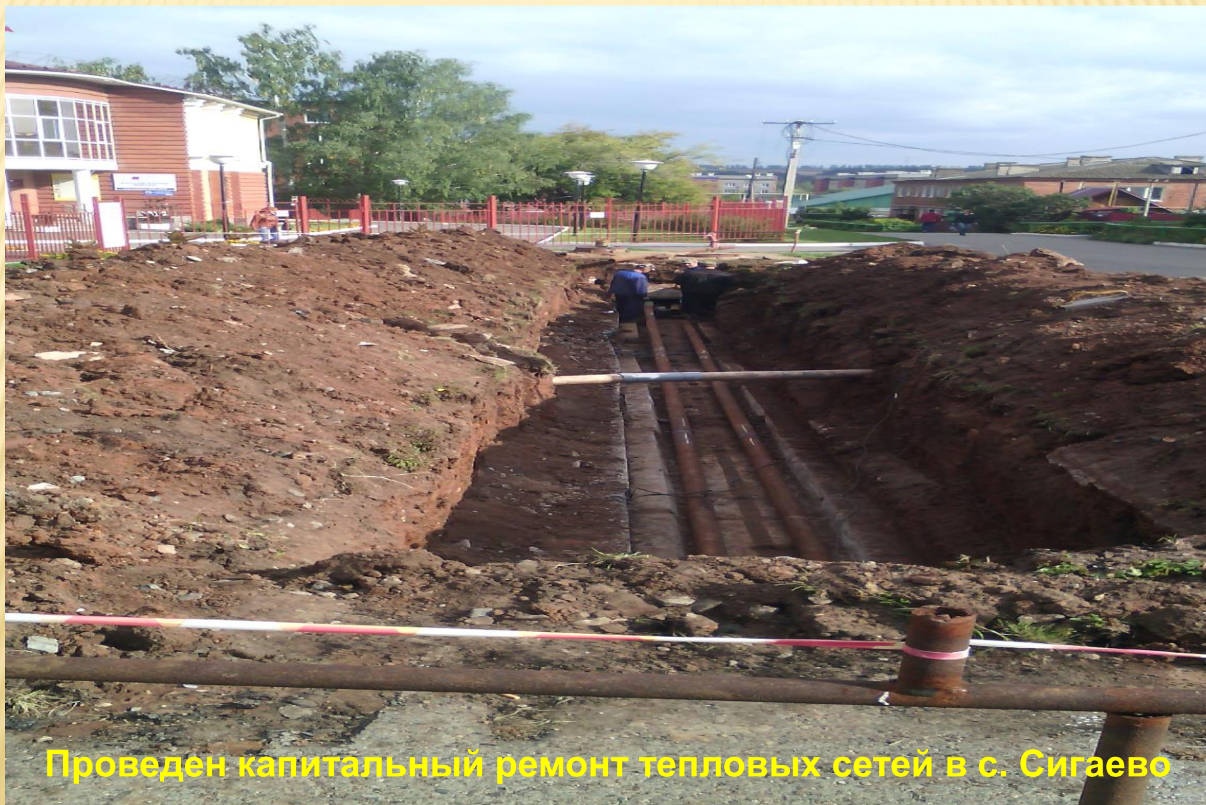
Проведен капитальный ремонт тепловых сетей в с. Сигаево