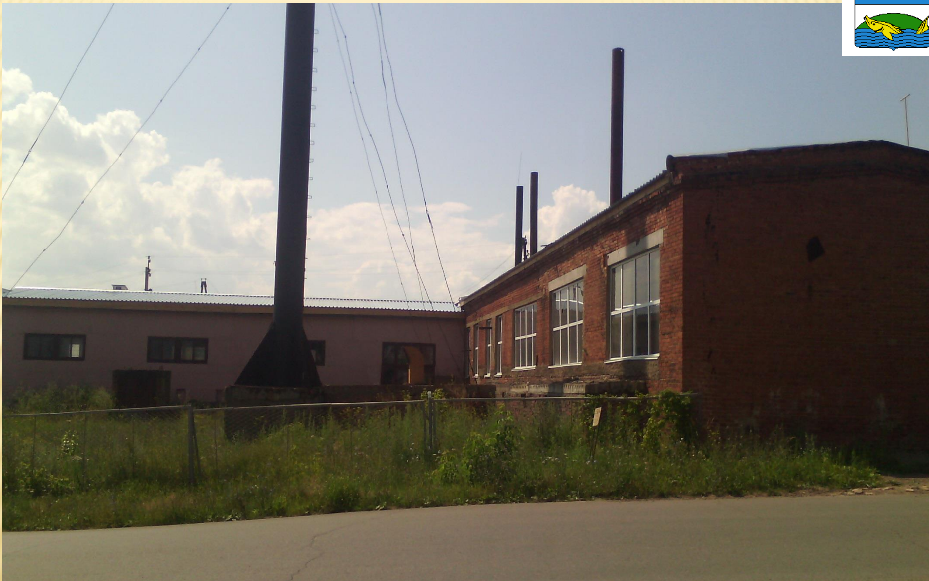
Покрашено здание и заменена кровля на вспомогательном здании котельной