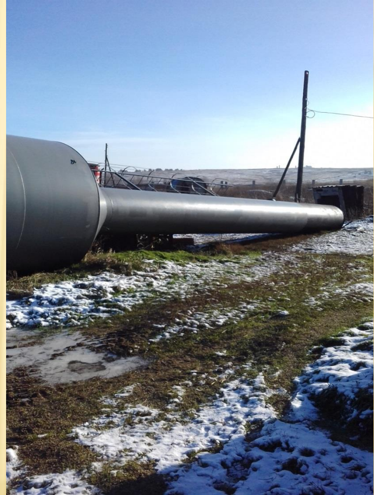
Приобретена водонапорная башня в с. Кигбаево (ул. Зеленая)