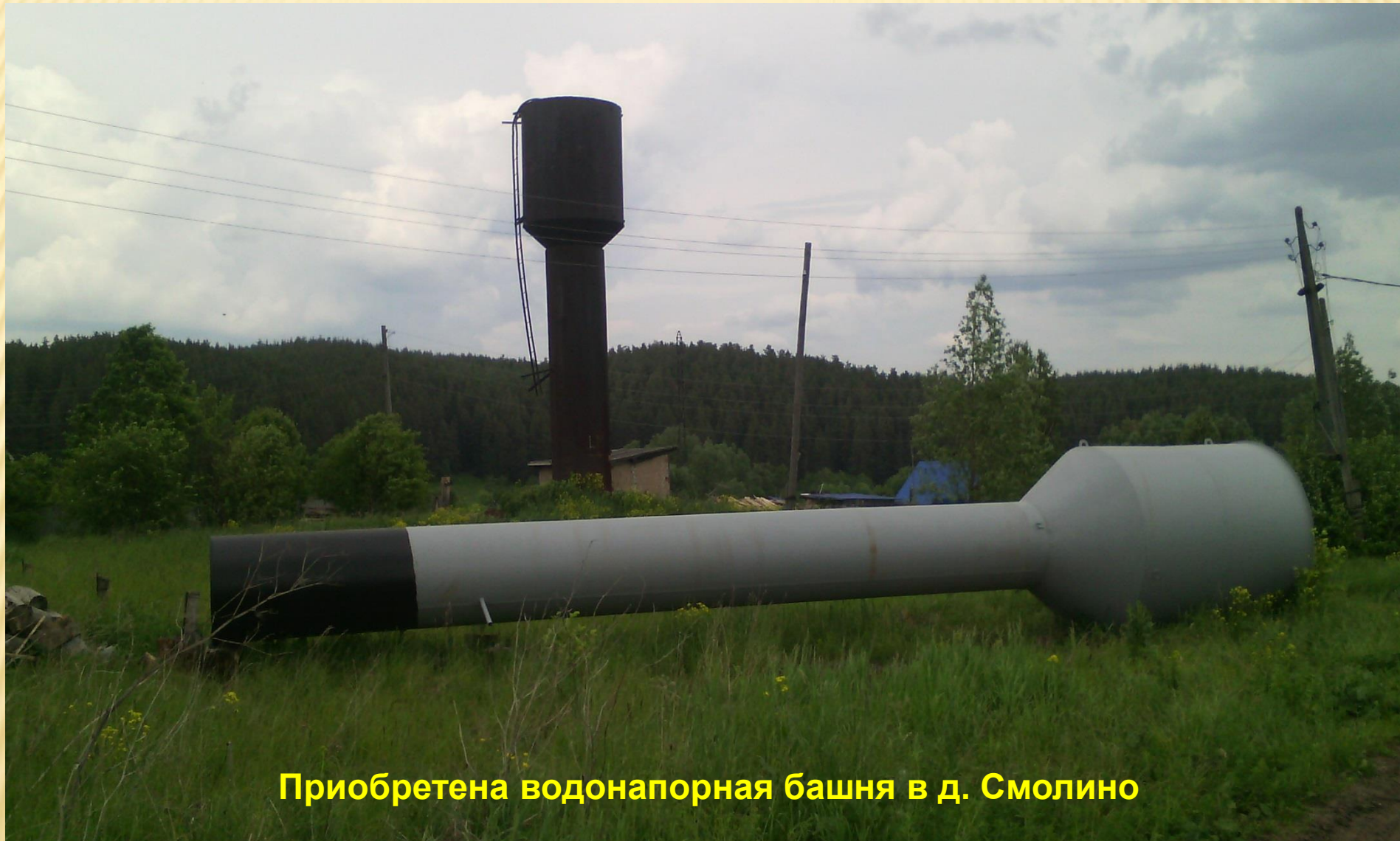
Приобретена водонапорная башня в д. Смолино