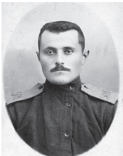
Рядовой 501-го Сарапульского полка 126 пехотной дивизии

К Дню памяти погибших в Первой мировой войне